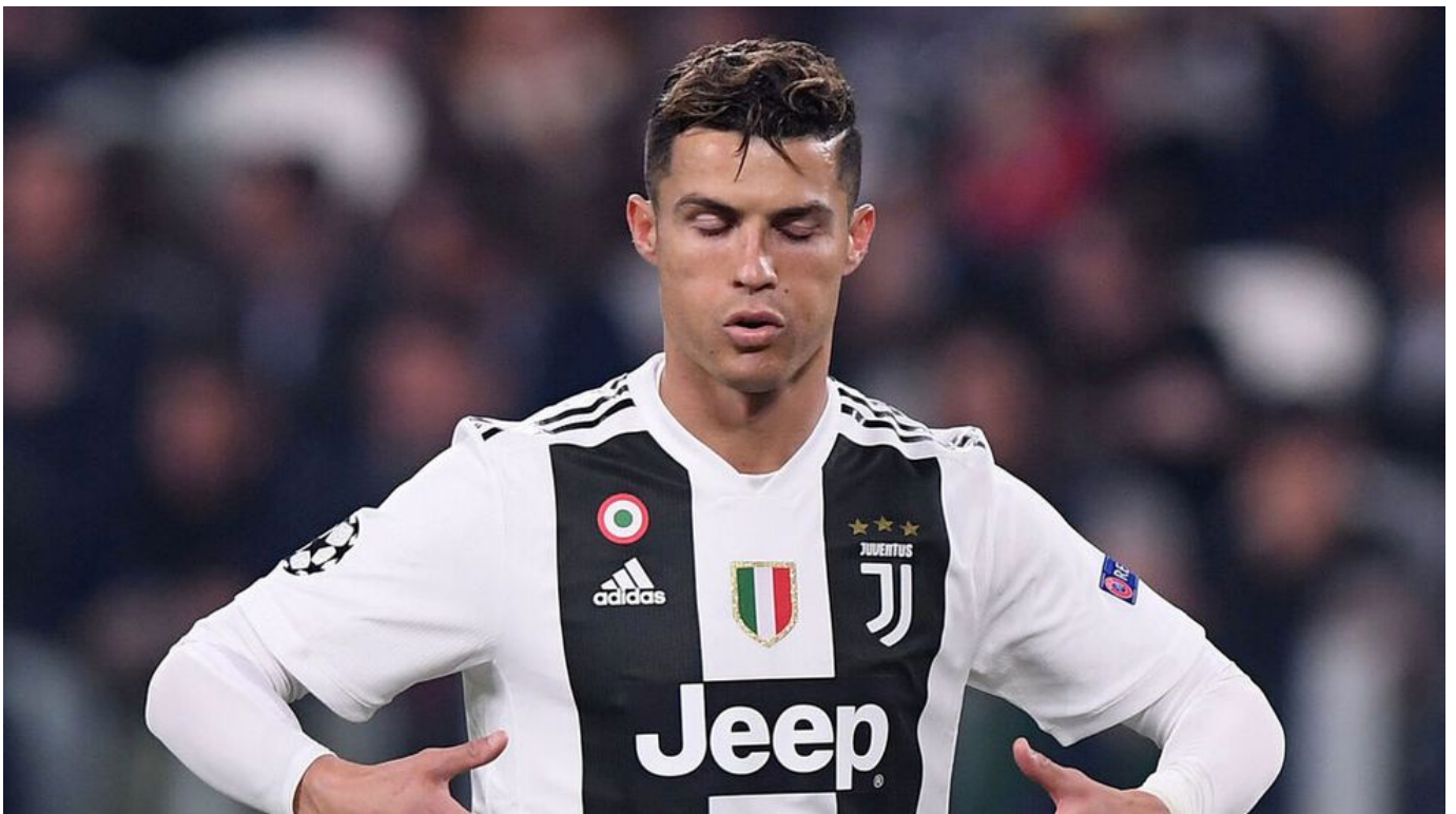
Cristiano viene pasando un gran momento con la camiseta de Juventus.

Otro dato que comprueba que lo del domingo no fue una casualidad, es la constancia con la que Cristiano viene rompiendo redes en el Calcio. En total ha marcado 10 dianas en los últimos seis partidos disputados y, en la última docena de duelos tan solo se ha quedado sin celebrar un tanto suyo en una sola oportunidad: en la Supercopa de Italia disputada frente a la Lazio el 22 de diciembre.